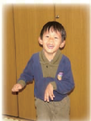
↑あっとほーむに来ていた保育園の頃の写真