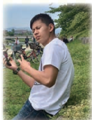
↑高校生になった今、ふらっとあっとほーむに来て、趣味の話でどんぐりパパと盛り上がる

あっとほーむは私にとっても1つの安心できる家みたいなところでした。私は小学校1年生頃から中学校2年生まであっとほーむに通っていたので、長い間とてもお世話になりました。 あっとほーむでは様々な行事を大切にされてきました。特に誕生日の子にメッセージカードを書いてくれた事を覚えています。そのボードをもらって、メッセ、タッフさんや友達からのメッセージが沢山書いてあって、自分の周りには自分を祝ってくれている人がたくさんいるんだなと実感できました。