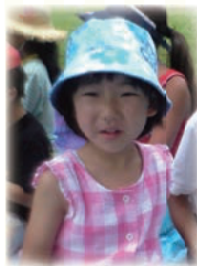
↑あっとほーむに来ていた小学生の頃の写真

あっとほーむは、小学校高学年、中高生の子どもたちに一軒家2階の一部を解放し、自由に過ごせる場所を提供しています。家や学校以外にも自分をありのままに表現できる居場所があることは、精神的な安定につながります。また、皆様のご寄付で中高生もあっとほーむで夜ごはんを食べてゆっくり過ごすことができます。