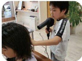
美容師体験 ヘアメイクアーティストさん