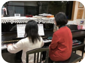
ピアノレッスン 小川先生