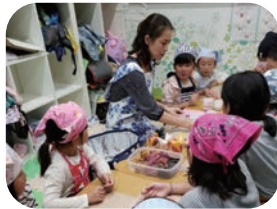
アイシングクッキー 作り Hくんママ